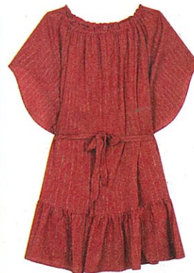
Légère Robe en coton rayée de Lurex or. 95€. AMENAPIH