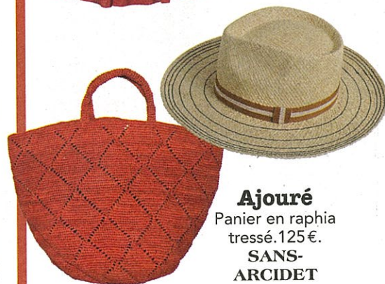
Ajouré Panier en raphia tressé. 125€. SANS- ARCIDET