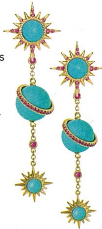
Astres Boucles d'oreilles à pendentifs en or jaune, turquoises et rubis. 7 134€. JENNY DEE chez Mad Lords