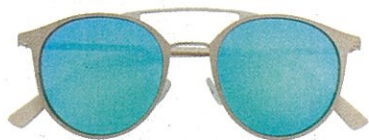
Solaires Lunettes en métal et verre. 59€. MEDLEY chez Optic 2000