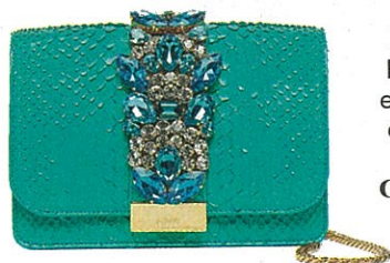
Bling Pochette en python et strass. 700€. GEDEBE