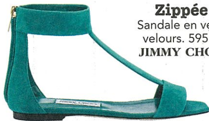
Zippée Sandale en veau velours. 595€. JIMMY CHOO